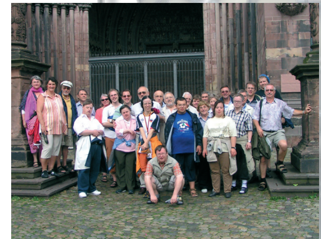
Konzertreise 2006 nach Freiburg

Konzerte in Freiburg, Niederlande, Belgien und Villeneuve d'Ascq bei Lille, einer Partnerstadt von Leverkusen in Frankreich.