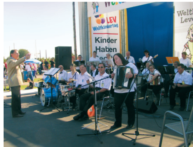
Weltkindertag 2007 im Neulandpark

Trompete, Posaune, Saxophon, Mundharmonika, Mandoline, Banjo, Akkordeon, Keyboard, Pauken, E-Bassgitarre, Schlagzeug, diverse Schlaginstrumente etc.